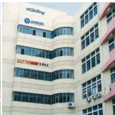
JUNKER servisní centrum pro Asii v Shanghai pásmu volného obchodu Waigaoqiao