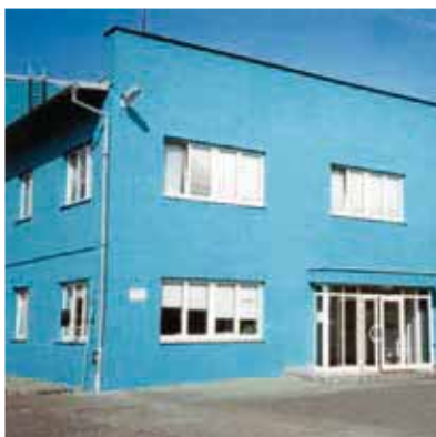
Servisní centrum pro Východní Evropu v Mělníku u Prahy, Česká republika

Základnu našich služeb JUNKER SERVICES v Severní Americe představuje Servisní centrum v Chicagu, USA. Stejně jako ostatní JUNKER servisní centra je také zmíněné pracoviště napojeno na vysoce moderní komunikační infrastrukturu firmy. Z rozsáhlého servisního skladu zásobujeme naše zákazníky v Severní Americe a Kanadě všemi důležitými náhradními díly v co nejkratší dodací lhůtě.