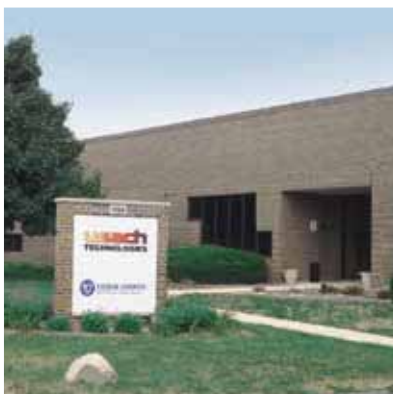
Servisní centrum pro Severní Ameriku, v Chicagu, USA