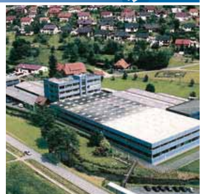
Hlavní sídlo firmy v Nordrachu, Německo

Nový koncept strojů firmy JUNKER s sebou nese jasné přednosti v oblasti servisu a využitelnosti. Ale také produktivita stoupá, neboť inovované konstrukce dovolují v případě omezeného prostoru kratší časy broušení a umožňují optimalizované strategie pro opracování.